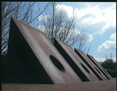
3. 「My sky hole85-8」 井上武吉 Bukichi Inoue