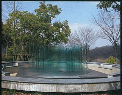
2. 「旋光」 多田美波 Minami Tada