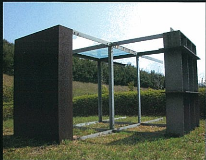
1. 「無題」 湯原和夫 Kazuo Yuhara