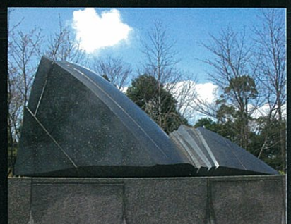
6. 「風の城」 流 政之 Masayuki Nagare