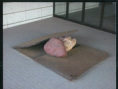
5. 「頂 2個の石と3枚の鉄板による」 李禹煥 Lee U Fan