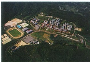
大阪教育大学柏原キャンパス

自然環境に恵まれた柏原キャンパスですが、さらに彫刻のある大学としても親しまれていくことと思います。今後さらに豊かな環境を活かしたユニークな作品が展示され、学内のみならず地域の方々や、来学される多くの方たちにも楽しんでいただけるようになればと願っています。