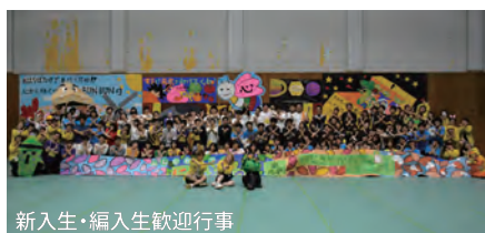
新入生・編入生歓迎行事