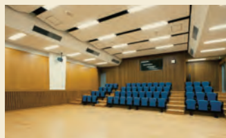
ミレニアムホール