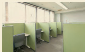
マロンルーム(学生自習室)