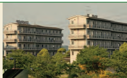
柏原キャンパス学生宿舎

※上記の金額は令和8年度の金額で、 在学中に改定が行われた場合には、改定時から適用されます。