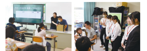
学校見学時の授業の様子と見学する学生たち

教育学部4年間を通して各教科コースの授業の受講と並行して「特別専攻科接続教育プログラム」を実施します。そのプログラムでは、特別支援教育に対する関心を深めるとともに、障がいの特性に応じた教科指導の在り方や、特別支援学校における教科指導の実践について、学校見学や現場で働く教員の講話を聴講することで、より理解を深めることができます。