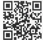
受付専用フォーム