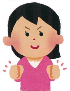
てんてん 3年目/学生

活動を通して子どもたちの笑顔と成長を間近で見ることができ、楽しみながら様々な体験ができます！ 経験がなくても大丈夫！ みんなで支えあってイベントを盛り上げていきましょう！！