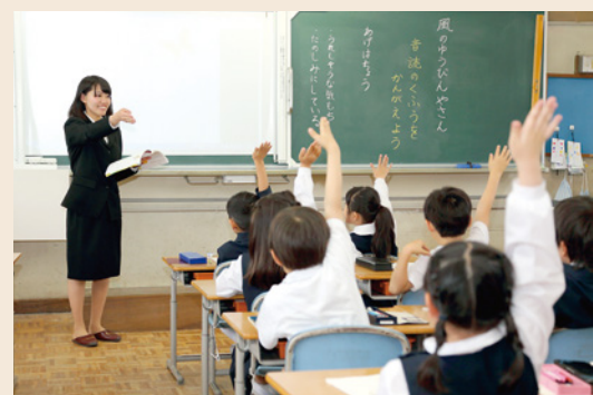
学校現場で学ぶこと