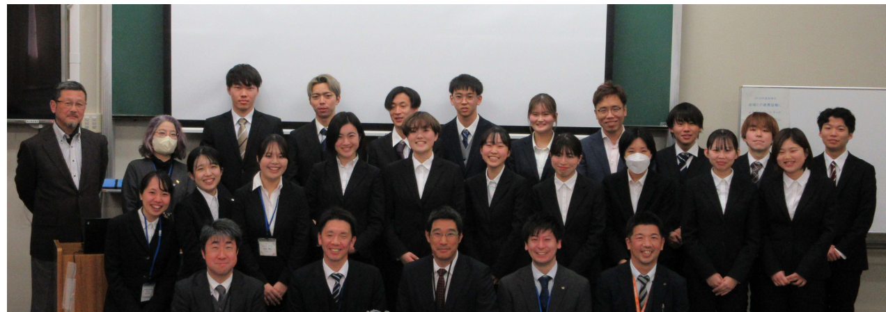
受講生、教員、支援頂いている府・市教育委員会の皆さん 2025年2月5日「人プロ・人権フィールド入門報告会」