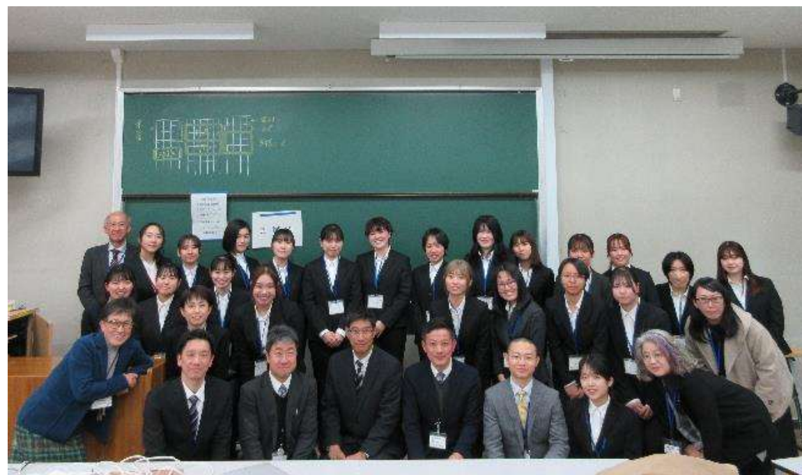
受講生、教員、支援頂いている府・市教育委員会の皆さん 2024年2月28日「人プロ・人権フィールド入門報告会」