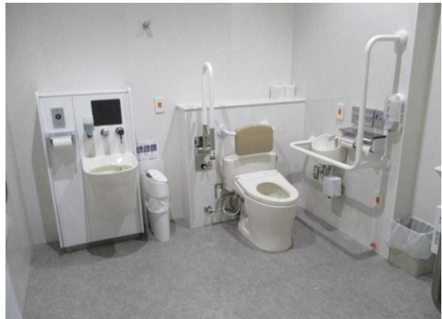
バリアフリートイレ個室