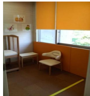
授乳室 (柏原キャンパス)