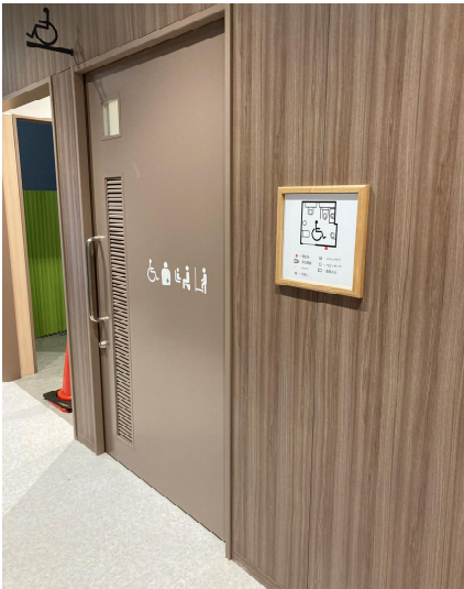
バリアフリートイレ入口（案内板等）