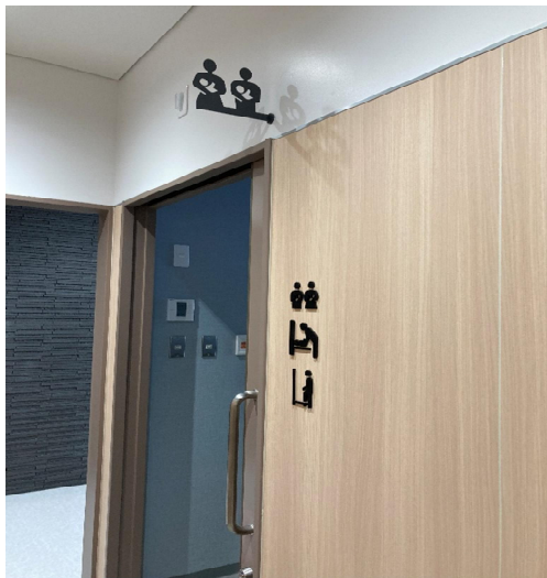
授乳室入口（中はV-1の写真参照）