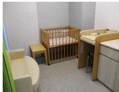
授乳室 (天王寺キャンパスみらい教育共創館)