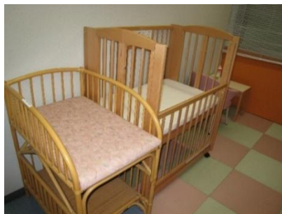
授乳室 (天王寺キャンパス中央館)