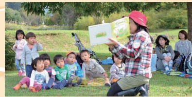
「森のようちえん」体験ブースも! キッズコーナーがパワーアップ!

主催:水都おおさか森林づくり・木づかい実行委員会 協賛:株式会社Kukkia/ブリオジャパン株式会社/株式会社トーセン/丸橋企画株式会社/FOREST MEDIA WORKS株式会社/株式会社ニシムラ精密地形模型/株式会社ロゴスコーポレーション/一般社団法人全国燃料協会/有限会社ヨクワークス/六甲山観光株式会社/出雲カーボン株式会社/林製紙株式会社/アルフル木工教室/NPO法人木育フォーラム/RECHERCHE(ルゼルシュ)/株式会社偕成社/能勢造林株式会社/株式会社カーボーイ/株式会社キシル/株式会社ビクセン 後援:国土交通省近畿地方整備局/近畿地方環境事務所/近畿農政局/三重県/滋賀県/京都府/奈良県/和歌山県/大阪市/大阪府教育委員会/滋賀県森林組合連合会/京都府森林組合連合会/奈良県森林組合連合会/兵庫県森林組合連合会/和歌山県森林組合連合会/滋賀県木材協会/一般社団法人京都府木材組合連合会/奈良県木材協同組合連合会/兵庫県木材業協同組合連合会/和歌山県木材協同組合連合会/内閣府公益社団法人大阪府猟友会/公益社団法人国土緑化推進機構/公益財団法人関西・大阪21世紀協会/公益財団法人国際花と緑の博覧会記念協会/帝国ホテル 大阪/産経新聞大阪本社/美しい森林づくり全国推進会議/森林環境の保全・整備連絡調整会議