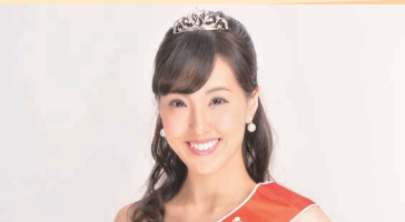
「2017準ミス日本」来場 林野庁「みどりの広報大使」