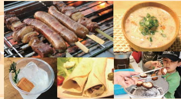
鹿汁や猪肉無料ふるまいも! 森林のごちそうフードコーナー