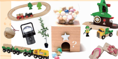
林業おもちゃも!当たって学べる 森林のガチャガチャ抽選会