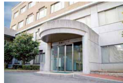
09 보건 센터 아프거나 부상을 당했을 때는 응급처치를 받을 수 있습니다. 또한, 심신상의 고민이 있으면 전문 카운슬러에게 상담할 수도 있습니다.