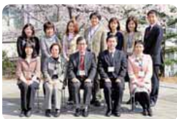
국제센터와 국제계의 직원

국제센터에는 센터장과 전임 교원 5명이 있습니다. 국제센터의 교원은 유학생을 위한 일본어와 일본 정세 등에 관한 수업 그리고 생활에 관한 지도를 실시하는 동시에 유학생이 언제든지 상담할 수 있도록 오피스 아워를 매일 실시하는 등 「유학생에게 친절한 대학」을 목표로 노력하고 있습니다. 오사카 교육대학에는 문과계, 이과계, 예술계, 스포츠계 등 모든 분야의 교원이 배치되어 있으며, 반드시 여러분이 배우고 싶은 분야가 있을 것입니다. 함께 공부해 보시지 않겠습니까?