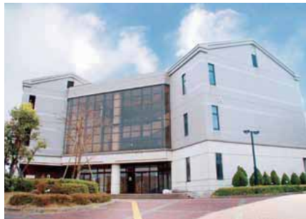
01 공룡 강의동 (A) 강의실, 시청각 교실, 정보처리 실습실, CALL교실 등이 있습니다.