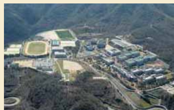
오사카 교육대학 가시와라 캠퍼스