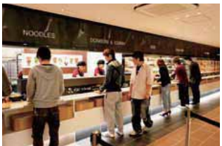
07 식당-레스토랑 뷔페식 레스토랑도 있어 학생들에게 인기가 높습니다.