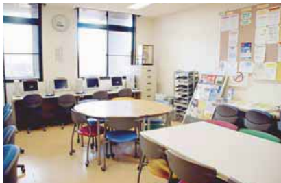
02 국제센터 (담화실) 유학생 여러분이 공부하거나, 교류의 장소로서 자유롭게 이용할 수 있는 방법입니다. 인터넷을 사용하거나, 리포트를 작성할 수 있습니다.