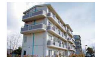
13 유학생 기숙사 (학생 기숙사) 40실을 준비하여 유학생에게 거주할 수 있는 침소를 제공하고 있습니다. 각 방에는 화장실, 세면대, 침대, 냉방고, 에어컨, 학습 책상, 책장, 의류보관함을 완비하고 있습니다. 주방, 샤워, 세탁기 등은 공용으로 사용합니다. 이 밖에도 캠퍼스 밖에도 유학생 기숙사가 9실 준비되어 있습니다. 각 방에서 인터넷도 이용할 수 있습니다.