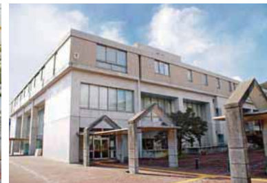
10 부속 도서관 책과 잡지의 대출 및 그 밖의 전자 미디어나 인터넷 단말기의 제공 등 정보에 광범위하게 접할 수 있는 환경이 정비되어 있습니다.