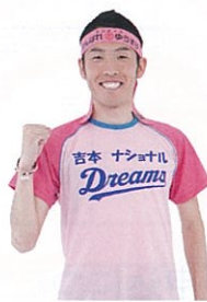
がんばれゆうすけ