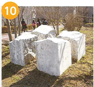
「TOUCHSTONE 1997 III」 國島和子(修了制作)