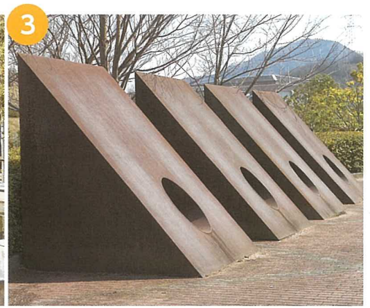
「My sky hole85-8」井上武吉