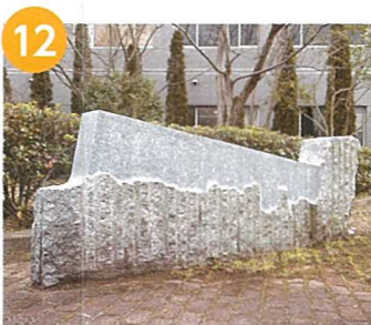
学生作品(実習共同制作)