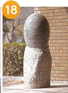
学生作品 (実習共同制作)