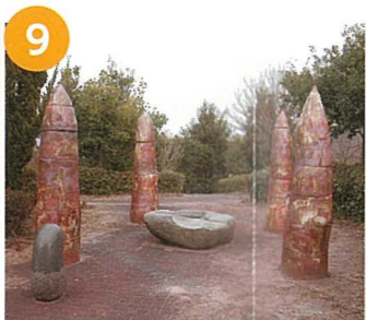
「陶と石による作品構成」 山田真理子(修了制作) &実習共同制作