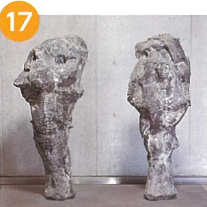
「Two figures」 加藤可奈衛 (美術教育講座准教授)