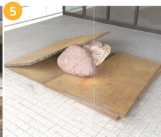
「頂 2個の石と3枚の鉄板による」 李禹煥