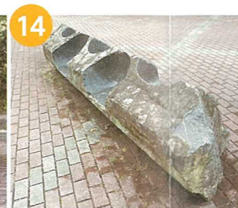
学生作品(実習共同制作)