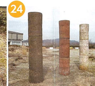
「untitled」 田中 涼(修了制作)