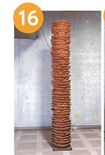
「月のおさがり」 田中 涼(卒業制作)