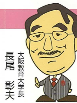
大阪教育大学長 長尾 彰夫

制作のワークショップ、彫刻ガイドツアーなど、随時実施します。ぜひ、一度お問い合わせください。