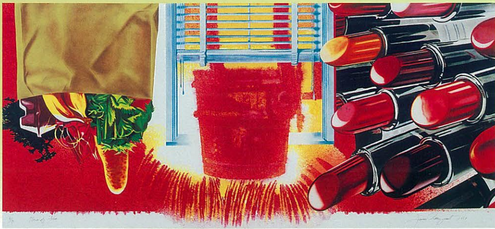
ジェームズ・ローゼンクイスト〈火の家〉1989年 © James Rosenquist/VAGA, New York, & JASPAR, Tokyo, 2013 B 0260