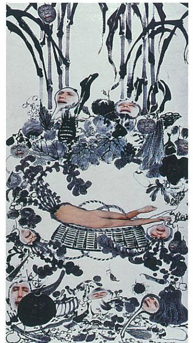
森村泰昌〈野菜涅槃(若冲)〉1990年

本展では、帯広美術館コレクションから、横尾忠則、矢柳剛、巖嘔、森村泰昌、ロイ・リクテンスタイン、サム・フランシス、フランク・ステラら、国内外の作品によって、多彩な20世紀のプリントアートをご紹介します。