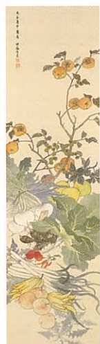
高島北海《果盛園》1920年 下関市立美術館蔵

会期中毎日先着20名様に、展覧会オリジナル「ペーパーボット」をプレゼント。水につけて数日すると中に入った草の種が芽吹きます。うまく芽吹けばあなたのところにも小さな神が訪れるかも!