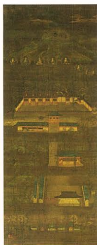
《生駒宮豊茶羅》鎌倉時代 奈良国立博物館蔵(10月7日まで) 重要文化財