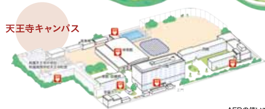
天王寺キャンパス