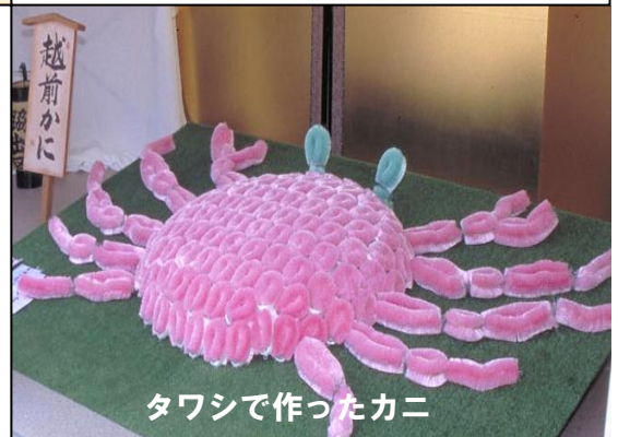
タワシで作ったカニ

tusuda@cc.osaka-kyoiku.ac.jp 電話 072-978-3603